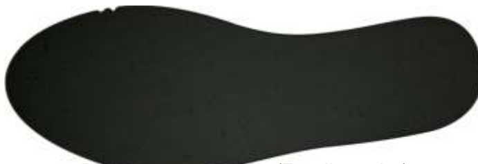
Palmilha amortecedora (Foto Ilustrativa)

9 - Palmilha Amortecedora - Palmilha de EVA de no mínimo 4,5 milímetros de espessura, dublada com sarja 100% algodão na cor Preta, com no mínimo 220 gramas por metro quadrado.