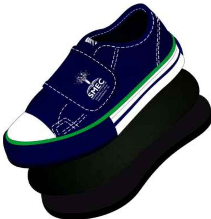
Vista externa (Foto Ilustrativa)

Por se tratar de um produto em produção fabril, exige-se que as dimensões dos calçados acompanham os padrões comerciais baseados na escala francesa cujo fator de conversão é 0,66667 centímetros de número a número. A medida realizada em calçado já confeccionado deverá ser efetuada na palmilha amortecedora ou palmilha de overloque, com variação permitida de 3% (+/-). Deve ter o Logo do órgão aplicado na Tira do Velcro. A marca da amostra deverá ser a mesma constante na proposta de preços junto com os laudos e conseqüentemente deverá permanecer inalterada durante toda a vigência da ata de registro de preços, sob pena de desclassificação e/ou cancelamento da ata.