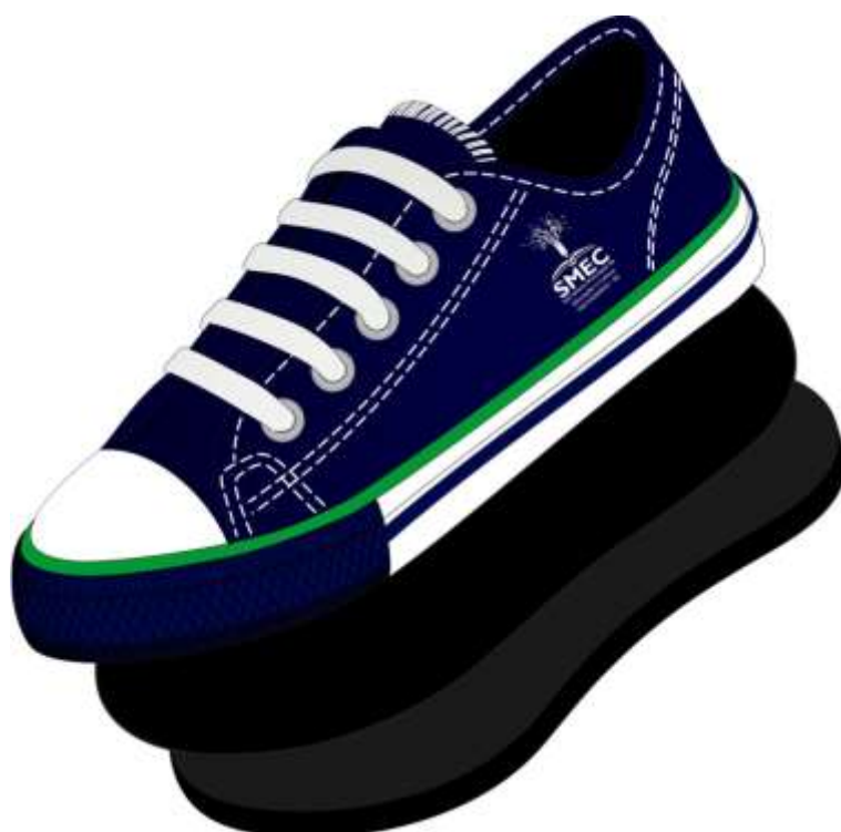
Vista externa (Foto Ilustrativa)

Por se tratar de um produto em produção fabril, exige-se que as dimensões dos calçados acompanham os padrões comerciais baseados na escala francesa cujo fator de conversão é 0,66667 centímetros de número a número. A medida realizada em calçado já confeccionado deverá ser efetuada na palmilha amortecedora ou palmilha de overloque, com variação permitida de 3% (+/-). Deve ter o Logo do órgão aplicado na Lateral do Tênis. A marca da amostra deverá ser a mesma constante na proposta de preços junto com os laudos e conseqüentemente deverá permanecer inalterada durante toda a vigência da ata de registro de preços, sob pena de desclassificação e/ou cancelamento da ata.