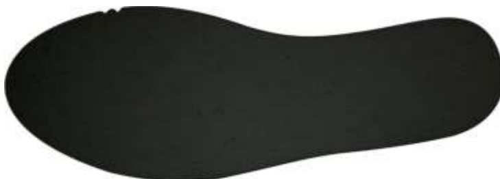
Palmilha amortecedora (Foto Ilustrativa)

10 - Palmilha Amortecedora - Palmilha de EVA de no mínimo 4,5 milímetros de espessura, dobrada com sarja 100% algodão na cor Preta, com no mínimo 220 gramas por metro quadrado.