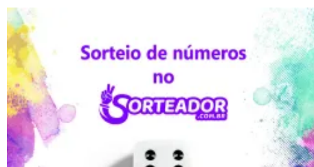
Sorteio de números