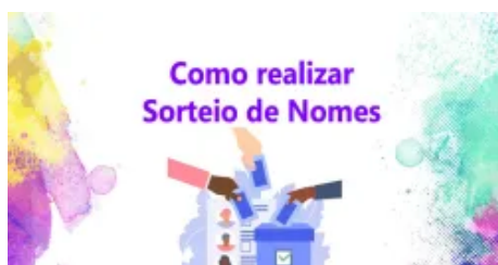
Sorteio de nomes

E se a Copa do Mundo: Catar 2022 fosse sorteada no Sorteador?